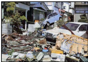
北茨城市 津波被害