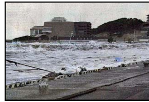
ひたちなか市 津波状況